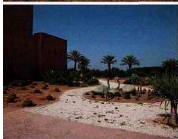
La faculté, une architecture moderne.