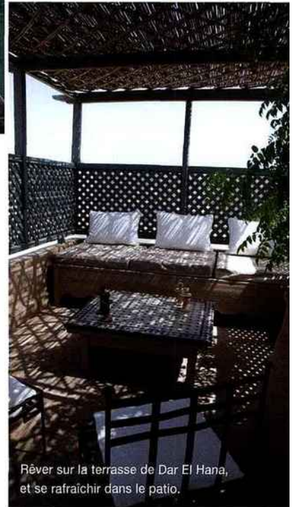
Rêver sur la terrasse de Dar El Hana, et se rafraîchir dans le patio.

La Gazelle d'or (tél. 00212 0528 852 039 et www.gazelledor.com ou reservation@gazelledor.com , à partir de 580 € pour 2 personnes en demi-pension). Ce nom de légende est assurément le plus sélect de la ville. Trente cottages disséminés dans les jardins, piscine et bassins, une ferme écologique et des hectares de domaine où se balader à pied ou à cheval.