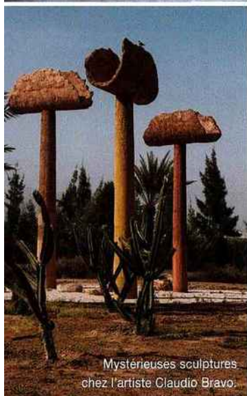
Mystérieuses sculptures chez l'artiste Claudio Bravo.